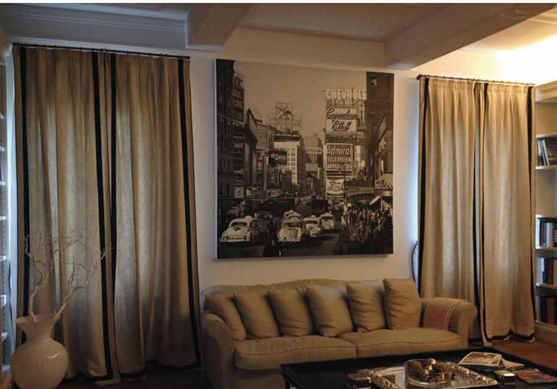
Progetto: Studio Sgroi - Bologna