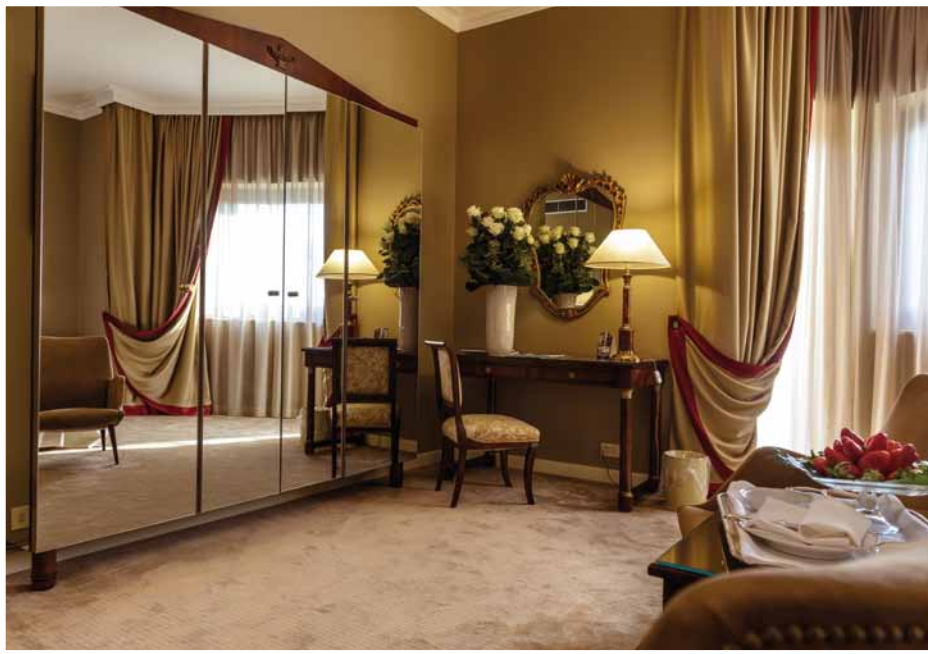
Progetto: Arch. Russo & Petroli - Palace Bari