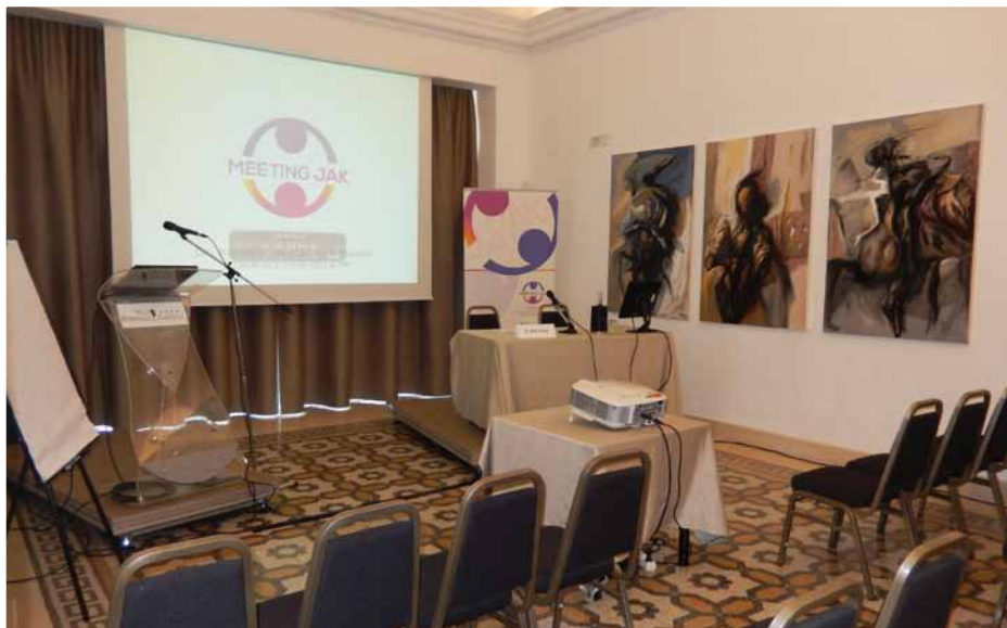
Progetto: Arch. Caterina Ranieri - Villa Romanazzi Carducci Bari