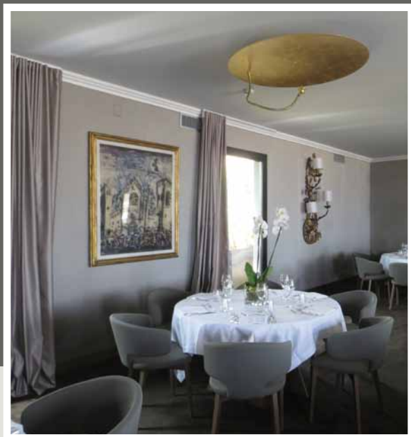
Progetto: Arch. Russo & Petrolì Palace Bari